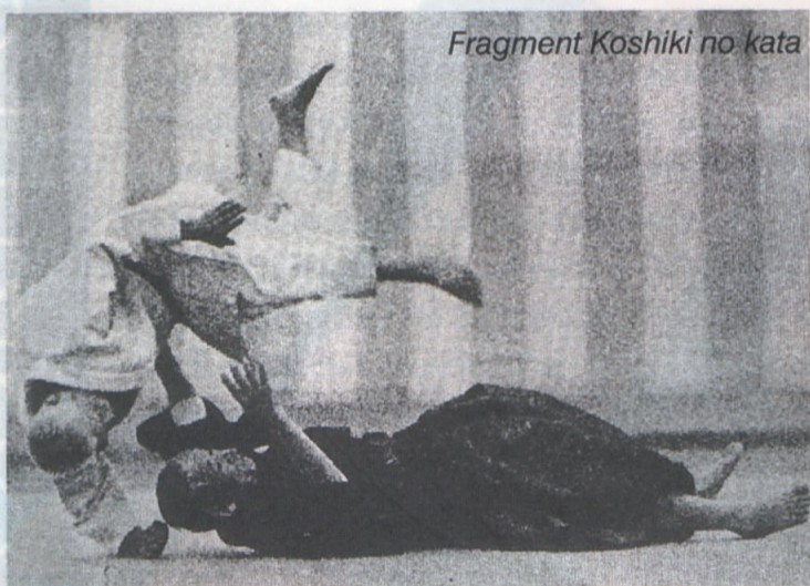
Fragment Koshiki no kata