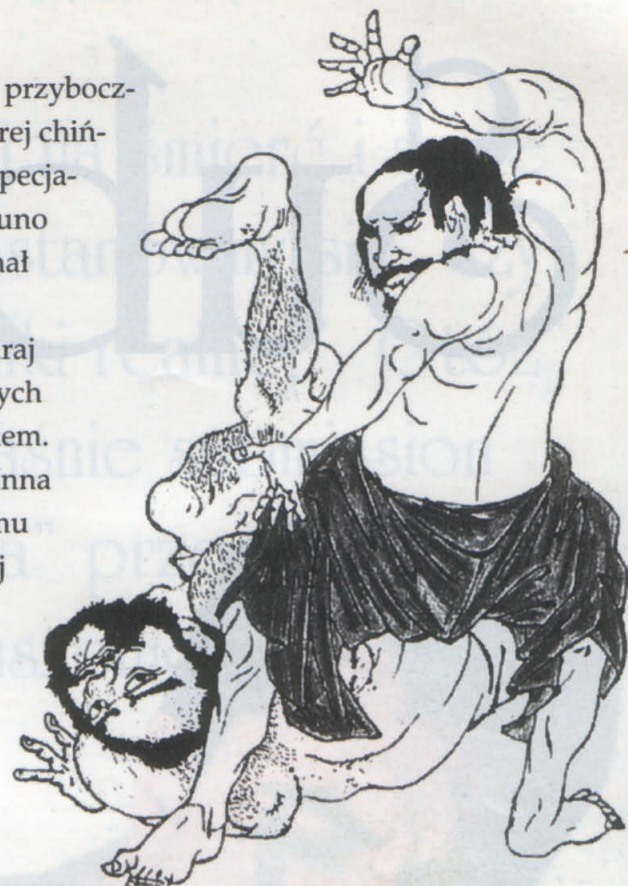
Stara technika jujutsu

Kito ryu koncentruje się nadal na twardym, chociaż ustępliwym podejściu do walki, przy czym nacisk kładziony jest na techniki rzutów i kata . Kito ryu istnieje do dzisiaj w trochę zmienionej formie. Natomiast poza nią oryginalne pojęcie Kito ryu zachowane jest na zawsze w kata judo—Koshiki no kata . ■