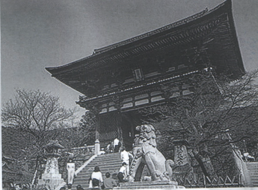
Świątynia Kiyomizudero w Tokio.

W walczących stronnictwach znaleźli się przedstawiciele rodów Minamoto i Taira. W 1156 roku rozegrały się pierwsze potyczki w stolicy, ale dopiero w 1159 doszło do wybuchu zamieszek zwanych „zamieszkami ery Heiji”. Tu zaczyna się dramat rodu Minamoto, który mimo dzielnej obrony zostaje prawie całkowicie wycięty. Ci, którzy nie zginęli w trakcie potyczek zostają straceni po ustaniu walk. Z całego pogromu zostali ocaleni tylko trzej synowie wojownika Minamoto Yoshitomo (dzięki interwencji Taira Kiyomori). Są to: dwunastoletni Yoritomo oraz Yoshitsune i Noriyori.