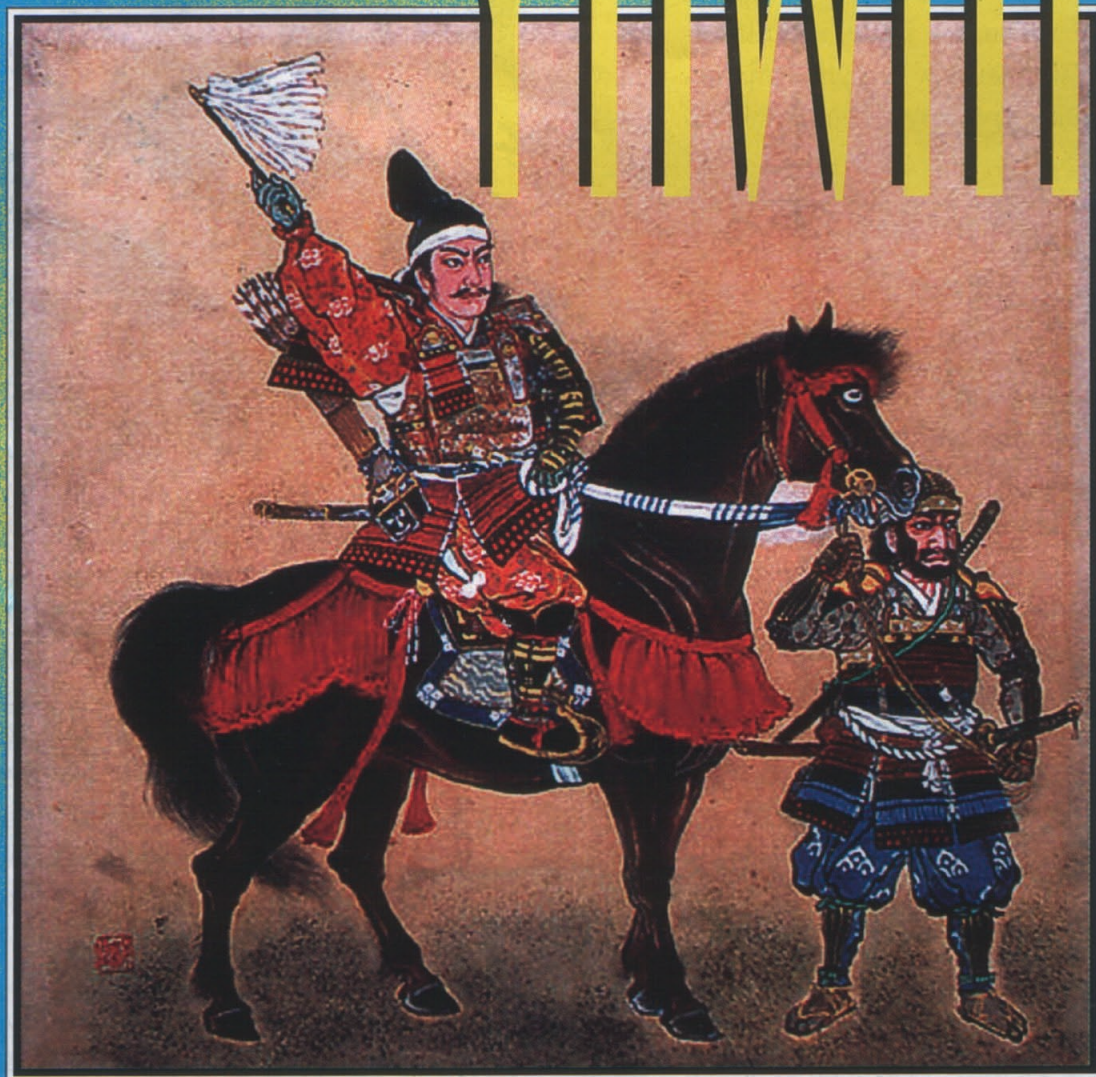
Shogun Minamoto Yoritomo.